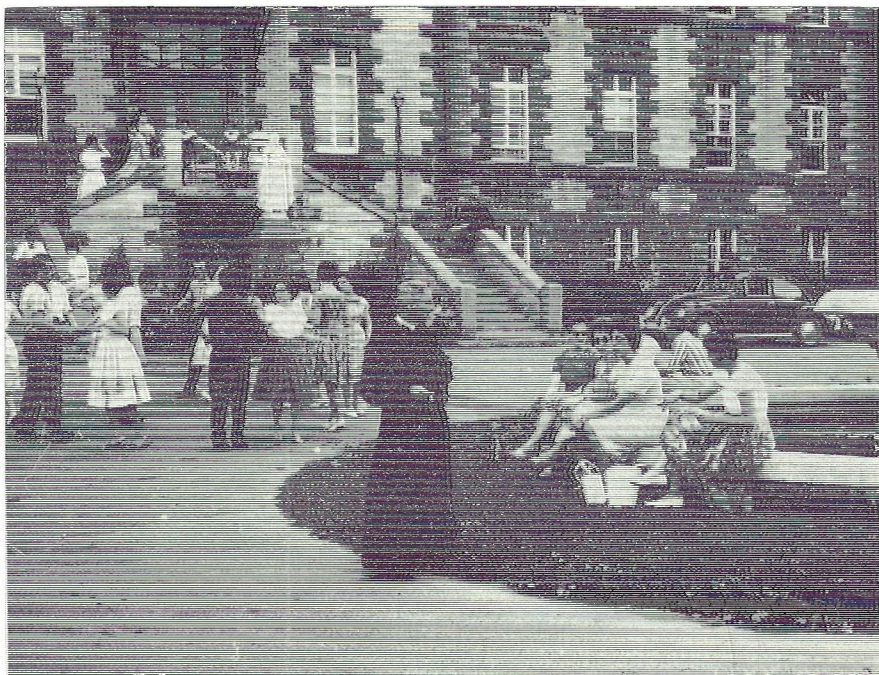
LES COURS D'ÉTÉ

En général ce sont des professeurs du Collège qui donnent ces cours, mais assez souvent ce sont des professeurs pris sur place.