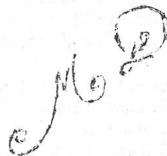
LA SEMAINE D'ORIENTATION